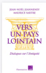
Jean-Noël Jeanneney "Vers un pays lointain"