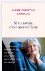
Marie-Christine Barrault "Si tu savais, c'est merveilleux" (Stock)