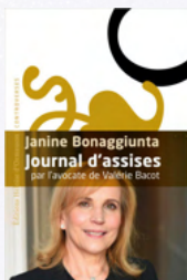
Janine Bonaggiunta "Journal d'assises" (éditions Héloïse d'Ormesson Controverses)