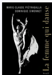
Marie-Claude Pietragalla "La femme qui danse" avec Dominique Simonnet (éditions du Seuil)