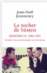
Jean-Noël Jeanneney "Le rocher de Süsten I et II" (Seuil)