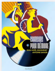
Jean-Noël Jeanneney "Chansons pour mémoire"