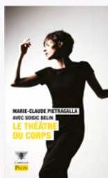
Marie-Claude Pietragalla "Le théâtre du Corps" avec Soïsic Belin (éditions L'Abeille Plon)